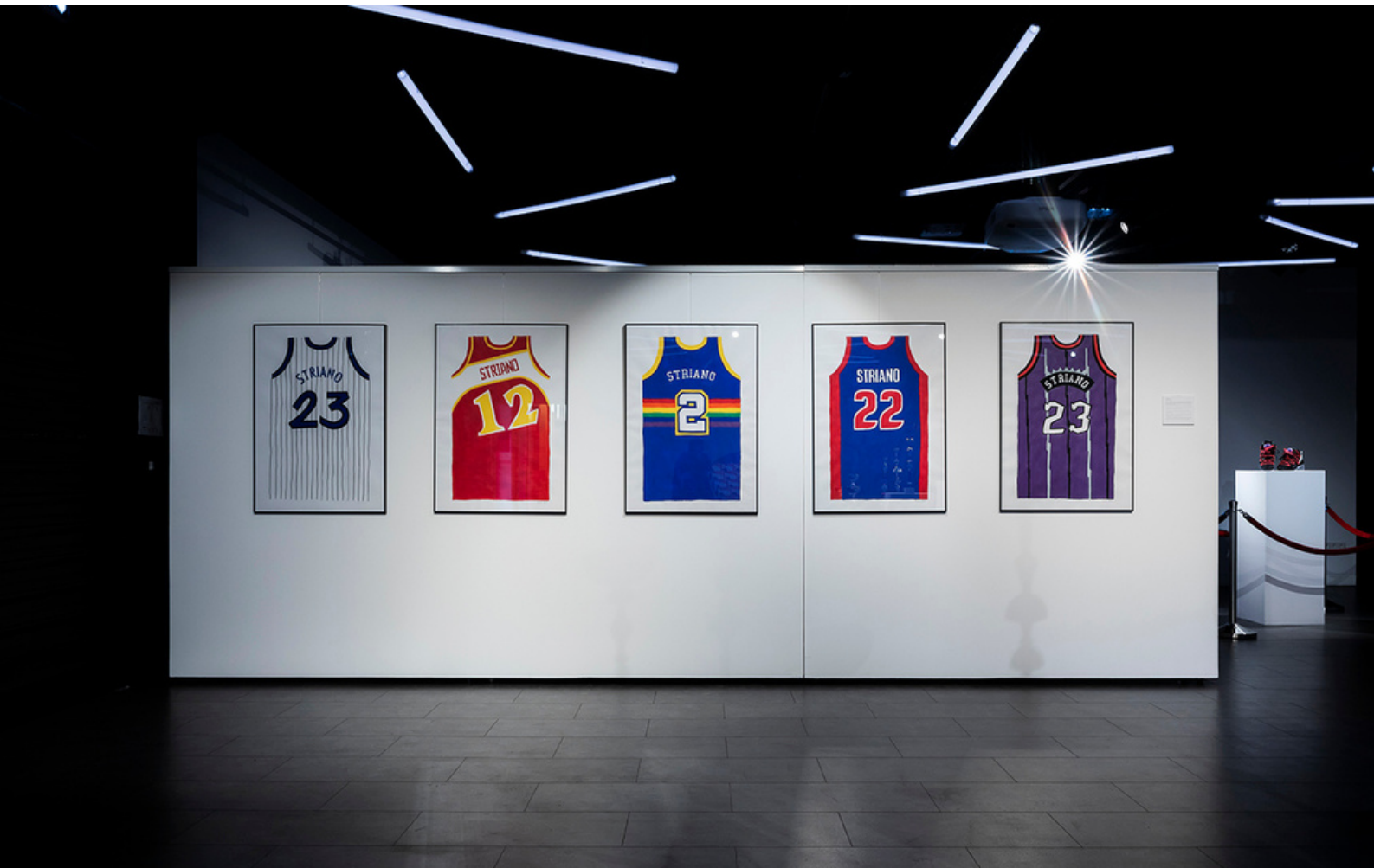
Jerseys - Peinture - Dunkorama : This boy knew - Kabart - 2021