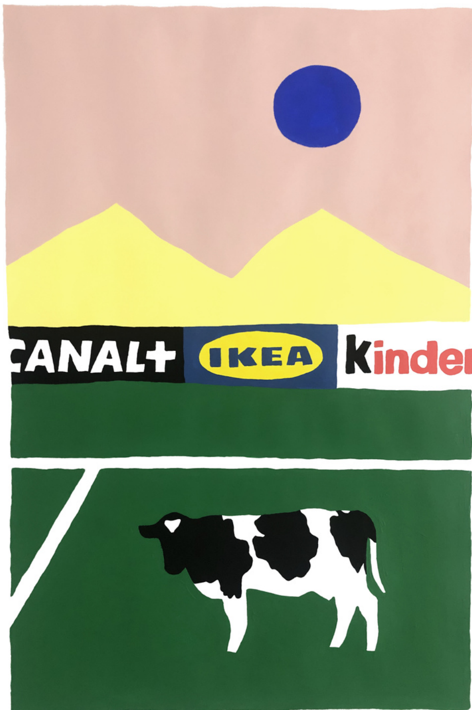
Que des numéros 10 - Terrain vague - Peinture - 12 la galerie - 2021