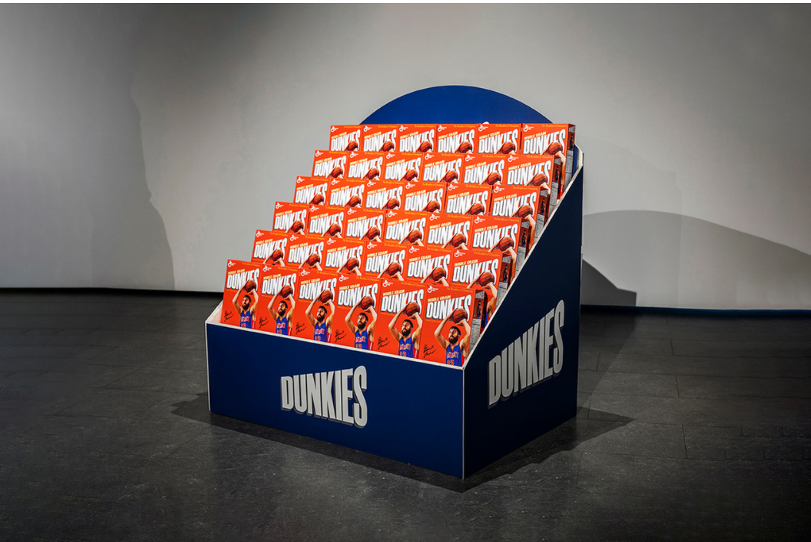
Dunkies - Installation - Dunkorama : This boy knew - Kabart - 2021