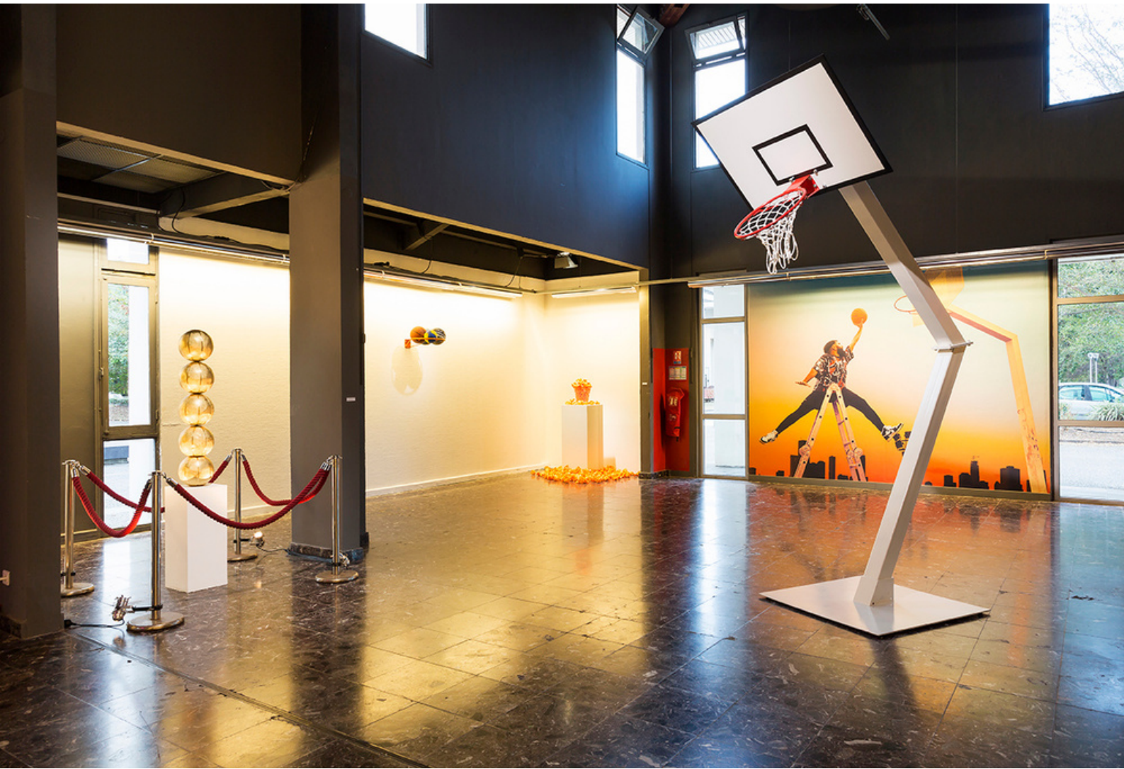
Dans les yeux - Installation - Dunkorama : Juste do it! - Teat Champ Fleuri - 2019