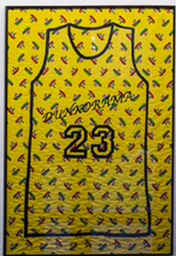
Jerseys - Peinture - Dunkorama : Juste do it! - Teat Champ Fleuri - 2019