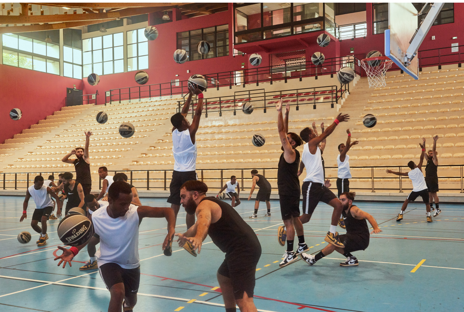
1 contre 1 - photo montage - Dunkorama : Juste do it! - Teat Cham Fleuri - 2019