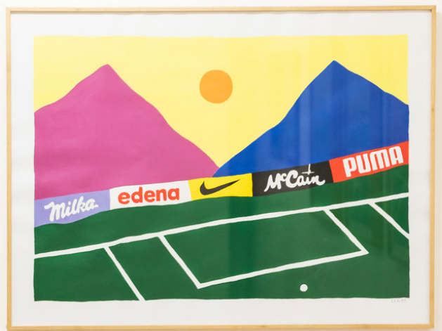
Terrain vague - Peinture - 12 la galerie - 2021