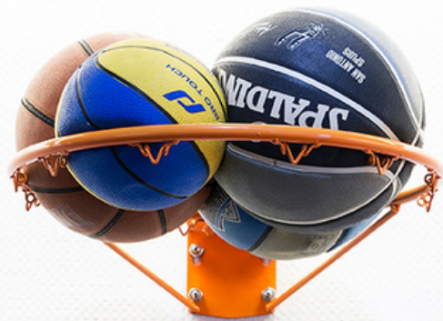
Shoots - Installation - Dunkorama : Juste do it! - Teat Champ Fleuri - 2019