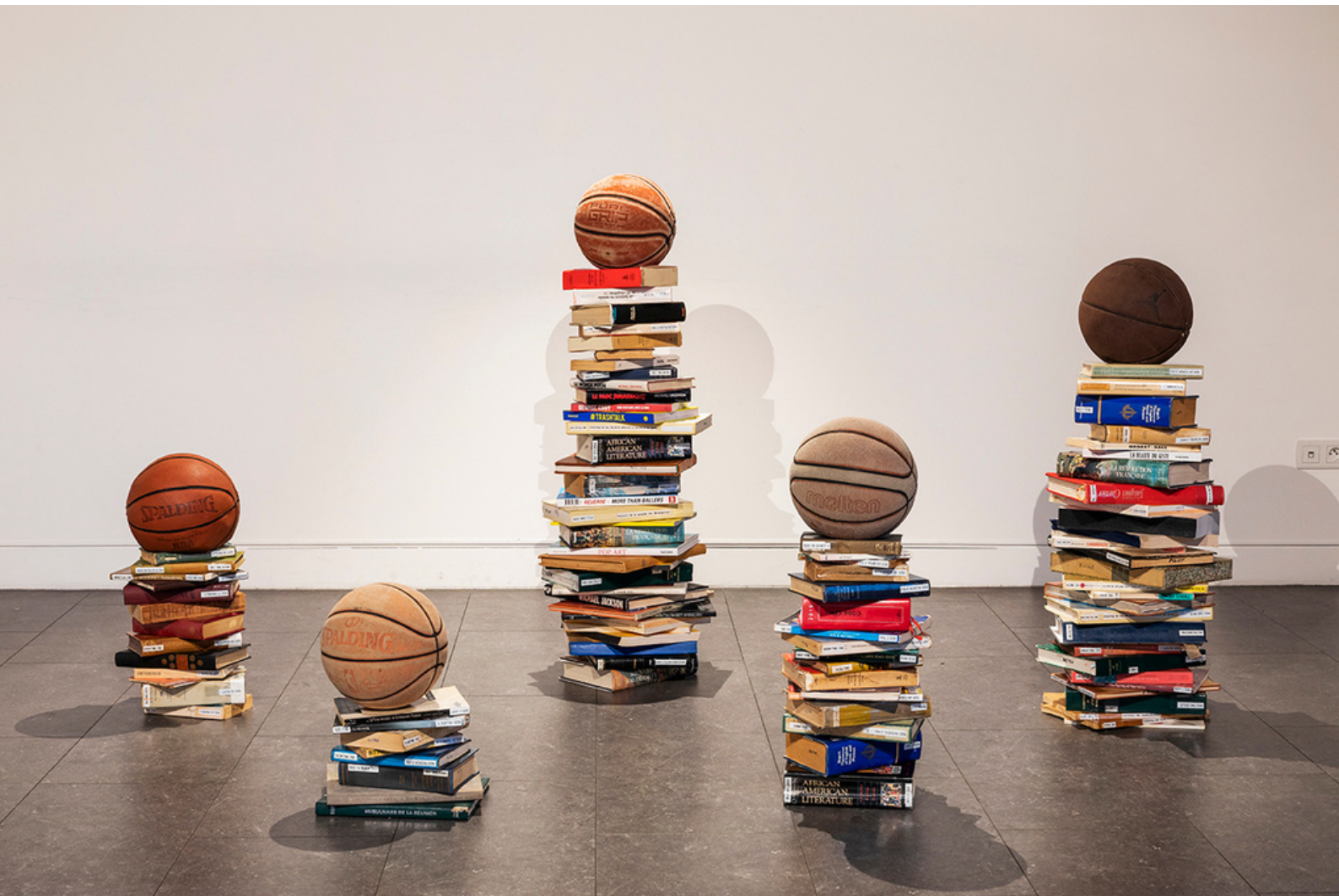
Sport-études - Installation - Dunkorama : This boy knew - Kabart - 2021