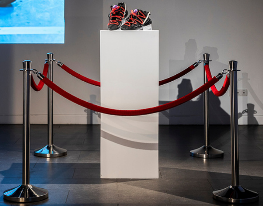
Dunk'R - Installation - Dunkorama : This boy knew - Kabart - 2021