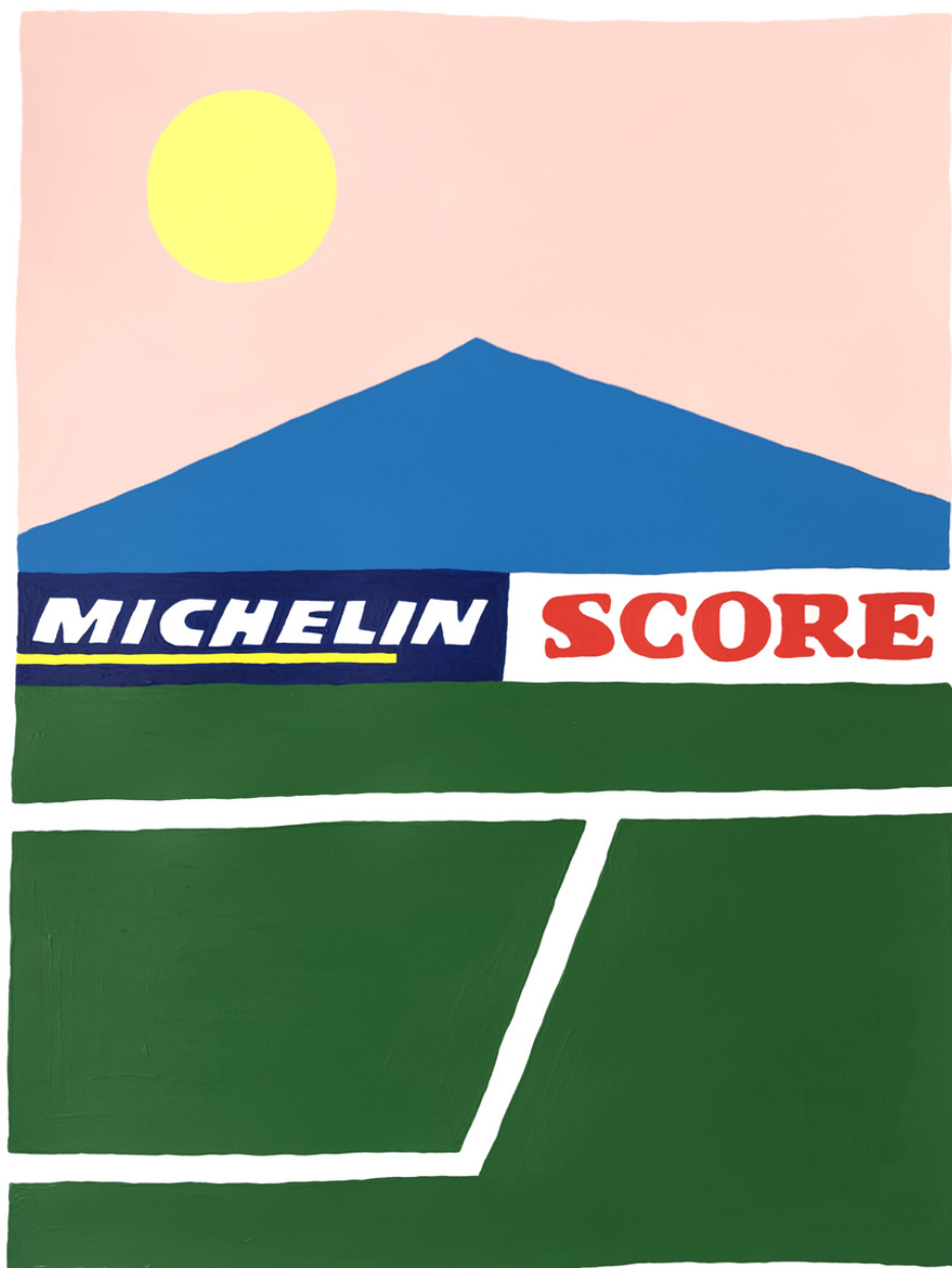
Centre à ras de terre - Terrain vague - Peinture - 12 la galerie - 2021