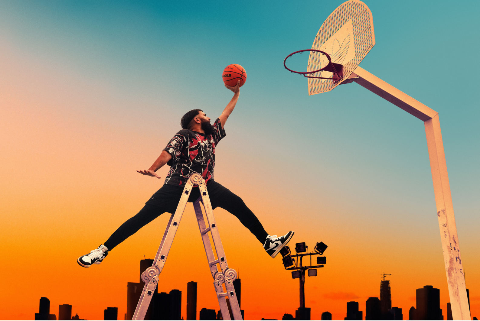
Je crois que je peux voler - photo montage - Dunkorama : Juste do it! - Teat Cham Fleuri - 2019