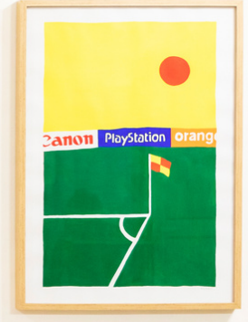
Terrain vague - Peinture - 12 la galerie - 2021